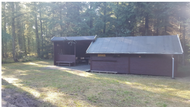
Jagthytten i Hvidbjerg Plantage

Ved anlæggelsen af plantagen blev der udelukkende plantet bjergfyr, da det var den eneste art, man kunne få til at gro på heden. Igennem årene er plantagen forynget med andre træarter. I en periode bestod plantagen næsten udelukkende af rødgran, men i dag er den en mere spændende og naturrig blandingsskov.