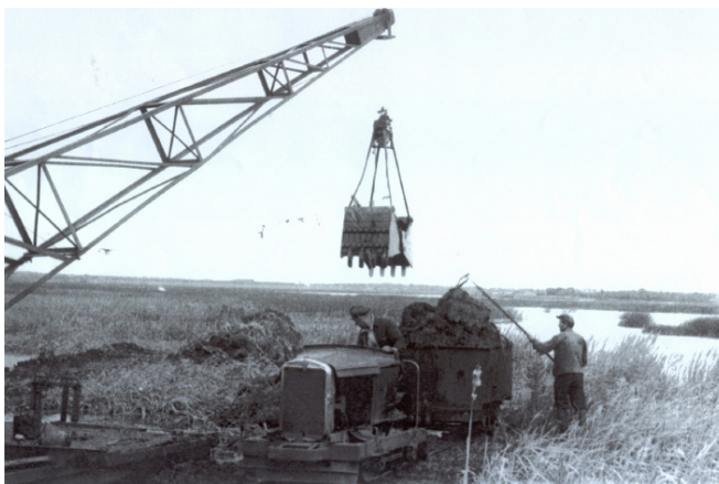
Tørvbearbejdet under krigen ved Rettrupkær Sø

Ejeren af Bomhus købte i 2004 en del af jorden fra Hvidbjerg Mosebrug og fik med hjælp fra Viborg Amt genoprettet søen. I 2004 blev søen indviet og fik passende navnet Rettrupkær Sø. Ved søens nordlige bred kan man fra fugletårnet studere områdets rige fugleliv og græssende køer.