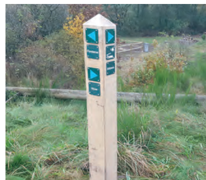
Eksempel på en piktogrampæl med rute-markering og vejvisere

Man kan også vælge at opsætte vejvisere, som fortæller, hvor man kommer hen, hvis man går i en given retning.