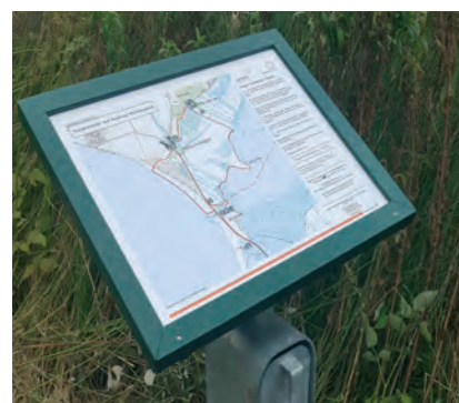
Eksempel på et kortbord med ruteoversigt

Ofte vil man også vælge at opsætte kortborde, hvor ruten starter, og eventuelt andre steder undervejs, som viser rutens forløb på et kort og opridser reglerne for færdsel i naturen.