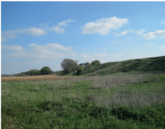
Foto: Kystskrænt ved Grætrup Strand

OBS. Ruten langs kysten kan være svær at passere ved høj vandstand i fjorden.