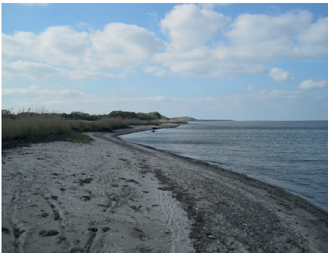
Foto: Stranden ved Grætrup

Kirken kan i dag anes på marken vest for mindepladsen, hvor man kan se kalk- og murstensrester, og en lille del af kirkediget kan endnu ses i mindehaven.