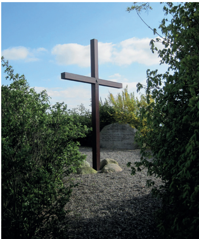
Foto: Mindesten for Grætrup Kirke

Kirkegården blev holdt ved lige i mange år efter kirkens nedrivning. Først omkring 1870 begyndte man at dyrke jorden, hvor kirkegården engang lå.