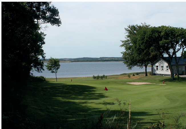
Foto: Udsigt over Harre Vig fra golfbanen

Ved Harre Vig Strand er der badebro, bord-bænke, shelter, madpakkehus, legeplads og toiletter. Strandens har fået tildelt Blå Flag gennem mange år.