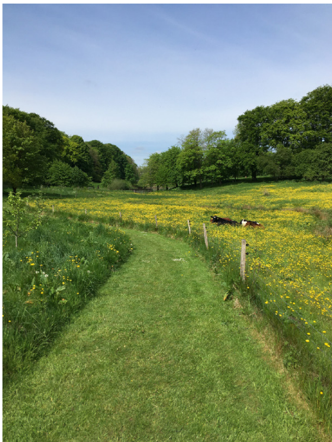
Foto: Eng ved rutestart ved Ørslevkloster

Fortsæt ellers ad Bådsgårdvej og drej ved Lær-kenborgvej, hvor der er flot udsigt over marker, skov og fjord. Man kommer blandt andet forbi gården Lærkenborg. Fra Hejlskov går turen tilbage til Ørslevkloster ad Hejlskovvej. Man går forbi Ørslevkloster Idrætsforening og Ørslevkloster Skole på turen tilbage til Ørslevkloster.