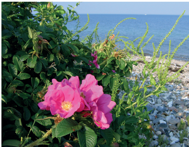
Foto: Rynket rose

Rynket rose er en invasiv art, som har været flittigt brugt til beplantning i sommerhusområder. Herfra har den spredt sig langs Danmarks kyster. Den klarer sig forbløffende godt i det lidt barske saltvandpåvirkede miljø.