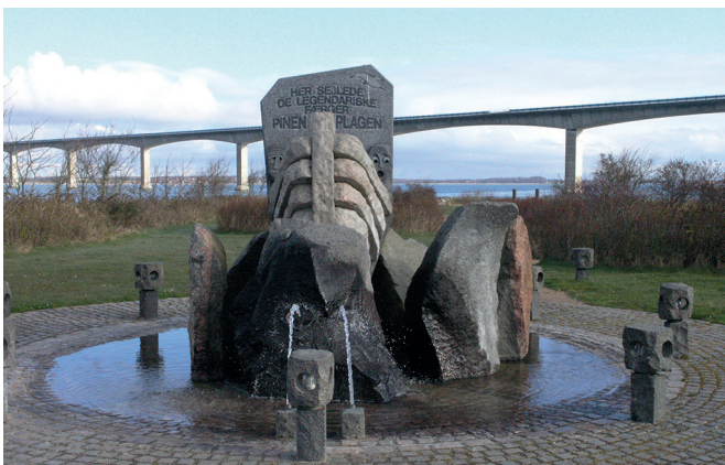
Foto: Mindesten for færgefarten Pinen og Plagen (Kunstner: Steen Jensen)

Man sejlede med den åbne færge over sundet frem til 1873, hvor den kommunale færgefart mellem Glyngøre og Nykøbing begyndte. Fra 1924, hvor personbiltrafikken vandt frem, begyndte man at krydse sundet mellem Pinen og Plagen med en motorfærge. Denne trafik fortsatte, indtil Sallingsundbroen blev åbnet.