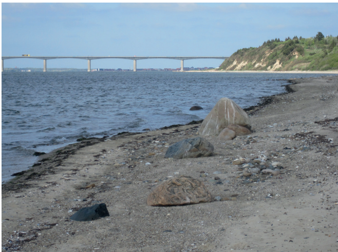
Foto: Stranden ved Sallingsund og Sallingsundbroen