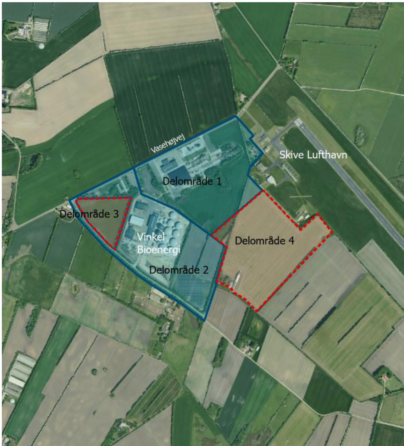
Figur 1 - Forslag til plan.

Forslaget kan tilpasses i forbindelse med planlægningen, herunder afgrænsningen. I delområde 3 ønskes etablering af græspoteinfabrik. I delområde 4 ønskes mulighed for etablering af biogasrelaterede aktiviteter.