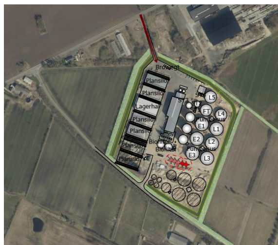
Primær adgangsvej til Vinkel Bioenergi er markeret med rødt i det nordvestlige hjørne.

Størstedelen af transportere ind og ud af anlægget vil efter udvidelsen stadig foregå ad Vinkelpletvej i anlæggets østlige hjørne.