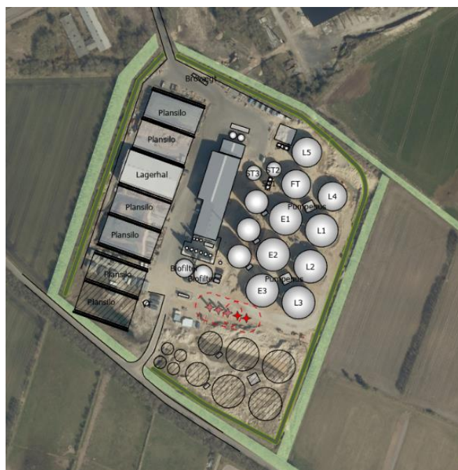
Vinkel Bioenergi. Udvidelsen etableres sydøst for eksisterende byggeri.