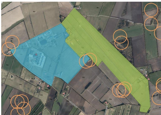
Det kommende lokalplanområde er markeret med blå. Nordøst for området er Skive Lufthavn markeret med grønt. Gravhøje fremgår som orange cirkler

Adgangsvejene til de ønskede delområder 3 og 4 er endnu ikke fastlagte.