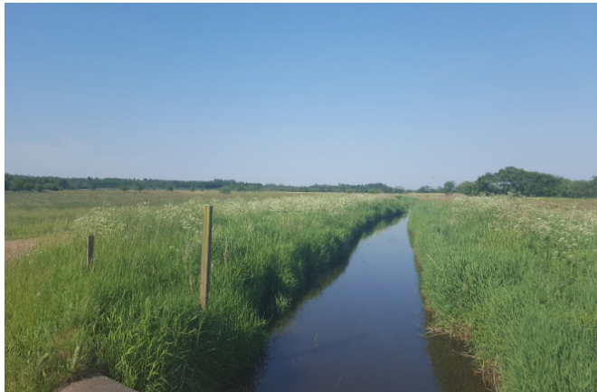
Trævel Å i Håsum Enge

Tilsvarende findes et tilmuret indgangsparti på kirketårnets sydside. Indgangen førte i sin tid ind til en begravningsplads for slægten Glob, der ejede Vellumgård. Bag Håsum Kirke ses kæmpehøjen „Klokkehøj“.