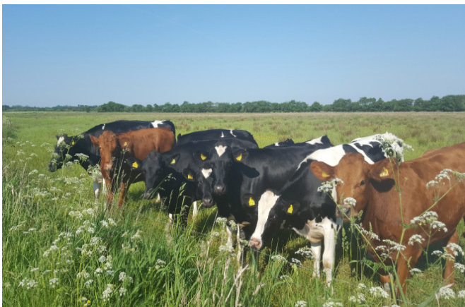
Naturplejere i Håsum Enge